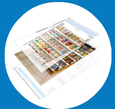
Planung von Umbauten und saisonalem Wechsel