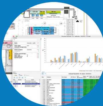
Analyse der Flächen- und Umsatzanteile